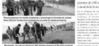
Trabajadores realizando la plantación de árboles en Juárez.

El Ayuntamiento de Juárez inició un proyecto de plantación de árboles en la zona rural de la ciudad, con el objetivo de mejorar el medio ambiente.