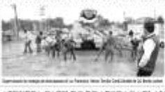
Trabajadores realizando obras de mantenimiento en la Avenida de la Unidad y la Avenida de la Libertad en la zona centro de Juárez.

El Ayuntamiento de Juárez, Coahuila, reforzó la avenida con concreto hidráulico en el tramo de la avenida de la Unidad y la avenida de la Libertad, mejorando la infraestructura vial y reduciendo el ruido. Este proyecto forma parte de las obras de mantenimiento y mejoramiento de la infraestructura vial de la ciudad.