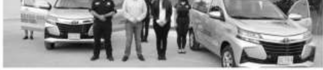
También se destinaron 2 patrullas que atenderán exclusivamente violencia familiar.