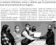
Entrega de reconocimientos a mujeres emprendedoras en Juárez.

El Ayuntamiento de Juárez, Coahuila, reconoció a las mujeres emprendedoras de la zona rural de la ciudad por su contribución al desarrollo económico. Este reconocimiento forma parte de las obras de apoyo a las mujeres emprendedoras de la ciudad.